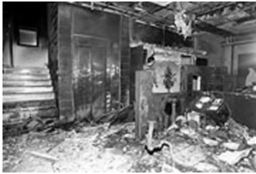
(φωτογραφία από το 3ήμερο φεστιβάλ της φωτιάς)

Στις 9/4/2008 η ΣΠΦ χτυπάει 8 στόχους ιταλικών συμφερόντων σε Αθήνα-Θεσσαλονίκη μεταξύ των οποίων αντιπροσωπείες ιταλικών αυτοκινήτων και υποκαταστημάτων της Benetton σε ένδειξη αλληλεγγύης στους διωκόμενους και στους φυλακισμένους αναρχικούς στην Ιταλία για την υπόθεση της FAI (Άτυπη Αναρχική Ομοσπονδία). Ήταν η πρώτη κίνηση διεθνούς αλληλεγγύης της οργάνωσης χτισμένη πάνω στην επιθυμία για διεθνοποίηση του επαναστατικού πολέμου. «Έτσι διαδίδουμε τη φωτιά της συνείδησης σε αυτήν την εμπόλεμη συνθήκη που διαλέξαμε για τους εαυτούς μας. Δεν εγκαταλείπουμε κανέναν φυλακισμένο σύντροφο, ούτε στην Ελλάδα, ούτε στην Ιταλία, ούτε πουθενά» (από την προκήρυξη της οργάνωσης για το συγκεκριμένο μπαράζ)