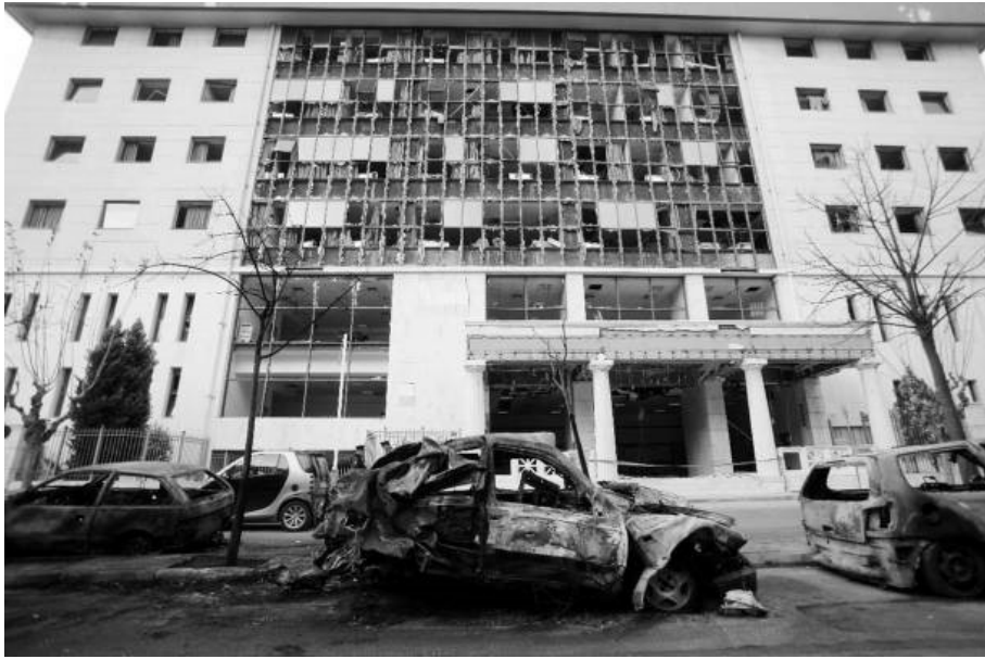
(φωτογραφία μετά τη βομβιστική επίθεση στο Πρωτοδικείο)

Στις αρχές του Φλεβάρη του 2011 δέμα βόμβα εξουδετερώνεται από πυροτεχνουργούς της Αστυνομίας στο Υπουργείο Δικαιοσύνης. Παραλήπτης είναι ο ίδιος ο υπουργός Χάρης Καστανίδης. Την αποστολή του δέματος αναλαμβάνει λίγες μέρες μετά η ΣΠΦ. Στην προκήρυξη γίνεται αναφορά στην απεργία πείνας που πραγματοποιούν φυλακισμένα μέλη και κατηγορούμενοι για τη συμμετοχή τους σε αυτή, για τις συνθήκες στις οποίες διεξάγεται η δίκη τους. Ακόμα, η οργάνωση δηλώνει δημόσια πως «από εδώ και πέρα» θα συμμετέχει στο Διεθνές Επαναστατικό Μέτωπο – Άτυπη Αναρχική Ομοσπονδία. «...Βέβαια η ανάγκη για στρατηγική είναι πιο ξεκάθαρη από ποτέ. Ο κεραυνός δεν ταξιδεύει ποτέ σε ευθείες επαναλαμβανόμενες γραμμές. Ξεσπάει αιφνιδιαστικά. Ακόμα και μια φαινομενική «σιγή», δεν είναι οπισθοχώρηση, αλλά η ησυχία πριν τη βροντή...»