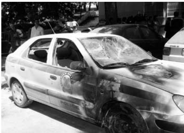
(φωτογραφία από την επίθεση στο Α.Τ. Δωδεκανήσου)

Στις 13/9/2008 το κομμάντο της ΣΠΦ «Ασύμμετρη Απειλή» επιτίθεται καταδρομικά με μολότοφ και γκαζάκια στο Αστυνομικό Τμήμα Δωδεκανήσου, όπου πυρπολούνται οχήματα και μηχανές της Αστυνομίας και προκαλούνται φθορές και στο ίδιο το Α.Τ.