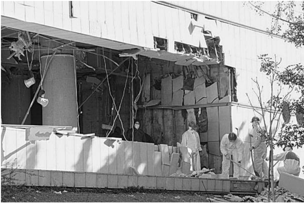
(φωτογραφία από την επίθεση στην Εθνική Ασφαλιστική)

Στις αρχές Γενάρη του 2010 σημειώνεται έκρηξη στον προαύλιο χώρο του ελληνικού κοινοβουλίου. Φθορές προκαλούνται στο φυλάκιο σκοπιάς του Αγνώστου Στρατιώτη και σε παράθυρα του κτιρίου της Βουλής. Η ΣΠΦ αναλαμβάνει την ευθύνη για την επίθεση μέσα από ένα κείμενο-πολεμική στην Δημοκρατία. Στην προκήρυξη γίνεται επίσης κριτική στους ψηφοφόρους που επιμένουν να αναθέτουν τη διαχείριση των ζώνων τους στους εκάστοτε υποψηφίους των διαφόρων κομμάτων.