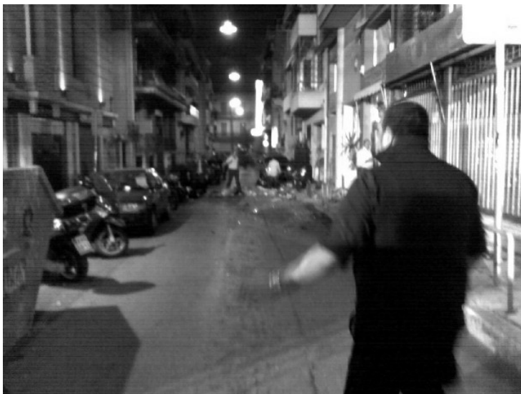
(φωτογραφία από την επίθεση στην οδό Γκιλφόρδου)

Στις 23/9/2009 εκρηκτικός μηχανισμός σκάει στην οικία της υπονήφιας τότε βουλευτή του ΠΑΣΟΚ Λούκας Κατσέλη στο Κολωνάκι. Στις 2/10/2009 ακόμα ένας μηχανισμός εκρήγνυται στην οδό Γκιλφόρδου κοντά στην εξέδρα (50 μέτρα απόσταση) από το σημείο όπου θα πραγματοποιούσε την προεκλογική του ομιλία ο τότε πρωθυπουργός Κ. Καραμανλής. Η ΣΠΦ αναλαμβάνει την ευθύνη και για τις δύο επιθέσεις. Στην προκήρυξη τοποθετείται κάθετα και διαχωριστικά απέναντι στις κοινωνικές συμπεριφορές που τροφοδοτούν και αναπαράγουν το σύστημα μέσα στο σύστημα, με αφορμή τις επερχόμενες εκλογές. «Από εδώ και πέρα η θέση της αδιαφορίας έχει καταργηθεί. Ο επαναστατικός τερρορισμός και εμείς ως Σνωμοσία Πυρήνων της Φωτιάς περνάμε το κατώφλι της κοινωνικής απειλής και της μηδενιστικής επίθεσης. [...] Θα παίξουμε ρόσικη ρουλέτα με το ρεβόλβερ της ζωής στα χέρια μας, αντί να σβήσουμε αργά και υπομονετικά μακριά από αυτά που αναζητήσαμε. Ξέρουμε πως δεν είμαστε μόνοι. Γνωρίζουμε πως τα νέα συντρόφια της φωτιάς είναι μαζί μας και είμαστε μαζί τους. Το νέο αντάρτικο πόλης πέρα από κάθε προσδοκία προσέθεσε τη δικιά του ξυραφιά στο πρόσωπο αυτού του κόσμου...»