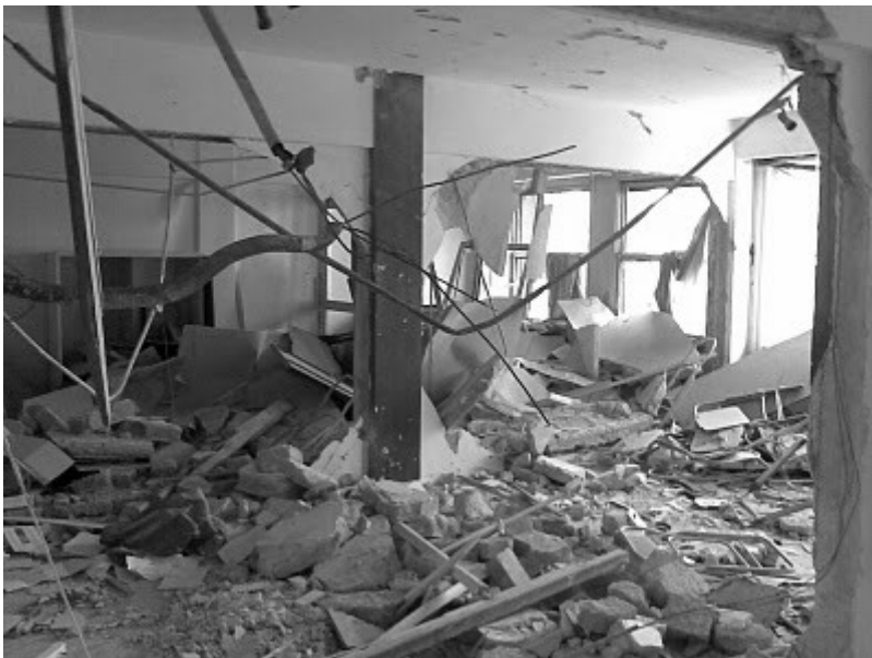
(τα γραφεία της Χρυσής Αυγής μετά τη βομβιστική επίθεση)

Στα μέσα του Μαΐου του 2009 σημειώνονται δύο ισχυρές εκρήξεις σε Αθήνα (φυλακές Κορυδαλλού) και Θεσσαλονίκη (Δικαστήρια). Η ΣΠΦ αναλαμβάνει την ευθύνη για τις δύο επιθέσεις με μια προκήρυξη στην οποία εξηγεί την επιλογή των στόχων αυτών. «Απέναντι στην αναγκαστική αναδίπλωση του εχθρού οι επαναστατικές δυνάμεις μπορούν να εκπονήσουν καινούργιους σχεδιασμούς και νέες στρατηγικές για την όξυνση της κατάστασης, για την κατάρρευση του συστήματος. Είναι αναμενόμενο πως το κράτος μπροστά στην κοινωνική κρίση που ξεσπάει απέναντι στα νέα οικονομικά μέτρα, θα προβάρει το ‘σιδηρούν προσωπίο’ του και θα ισχυροποιήσει τους παραδοσιακούς συντηρητικούς θεσμούς. Για αυτό το λόγο βάλουμε στο στόχαστρο ‘παλαιάς’ κοπής μηχανισμούς της εξουσίας. Ταυτόχρονα μέσα απ’ τα χτυπήματά μας, θέλουμε να θέσουμε σε κίνηση μια από τις βασικές μας προτεραιότητες που είναι η άμεση απελευθέρωση των αιχμάλωτων κρατουμένων. Στο ταξίδι της επανάστασης που έχουμε ξαμοληθεί η θέση τους είναι πάντα δίπλα μας...»